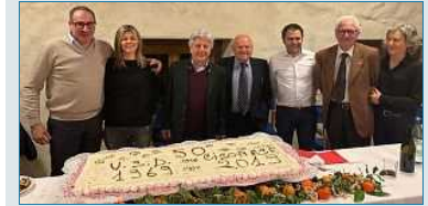
L'Unione Sportiva Cisonese festeggia i suoi primi 50 anni con un calendario celebrativo durante la cena di Natale