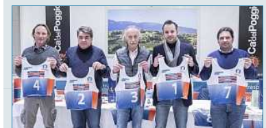
Presentato a Ca' del Poggio il Grand Prix Emaprice 2019-20: finali sul Monte Verena con la novità del parallelo