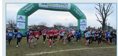
Staffette da record sui prati di Mareno di Piave: quattro i titoli provinciali andati alle società