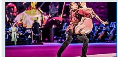
San Vendemiano, i campioni di danza su ghiaccio Cappellini e Lanotte ospiti a "Magie d'Inverno"