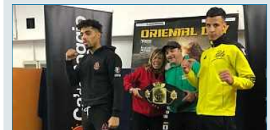
Fighters Before Christmas: Free Sport ha portato le stelle del combattimento a Godega di Sant'urbano