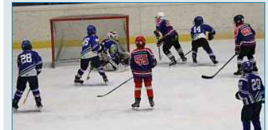
San Vendemiano, i piccoli atleti dell'Ice Team Sanve alle sfide con i team di montagna: "Stiamo crescendo"