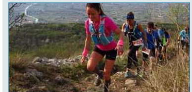
Tutti pazzi per il trail, la Scuola di Maratona di Vittorio Veneto pianifica tre appuntamenti per il 2020