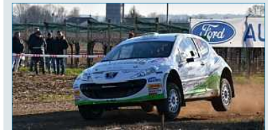
Il campione italiano rally Giandomenico Basso apripista per 172 equipaggi al 21.mo Prealpi Master Show