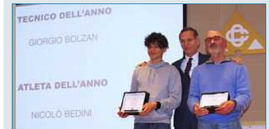
A Tarzo la festa provinciale e le premiazioni per una stagione da record dell'atletica trevigiana