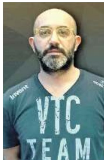
IL TECNICO Totire

NOTE: San Donà: 4 muri, 7 ace, 17 errori in battuta, 13 errori azione, 45% in attacco, 48% (38%) in ricezione. Trento: 6 muri, 7 ace, 20 errori in battuta, 17 errori azione, 42% in attacco, 27% (13%) in ricezione.